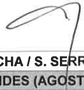
TABELA 1: LEITORES AUSENTES, RESPECTIVAS ZONAS E MESES